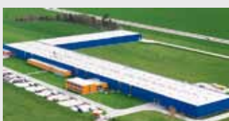
Hörmann Legnica Sp. z o.o., Польша