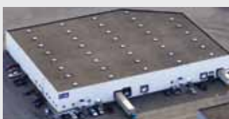
Hörmann Flexon, Leetsdale PA, США

Hörmann – единственный производитель на международном рынке, предлагающий «из одних рук» все основные строительные элементы, которые изготавливаются на высокоспециализированных предприятиях в соответствии с новейшими техническими достижениями. Имея широкую торговую и сервисную сеть в Европе и представительства в Америке и Китае, Hörmann является надежным поставщиком высококачественных строительных конструкций. Hörmann – качество без компромиссов.