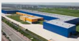
Hörmann Tianjin, Китай