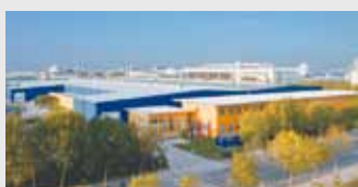
Hörmann Beijing, Китай