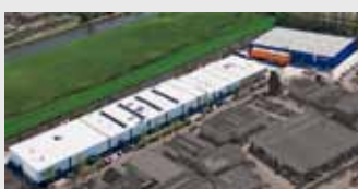
Hörmann Alkmaar B.V., Нидерланды