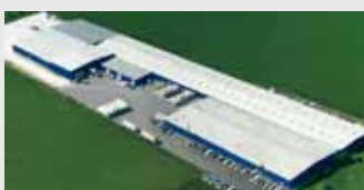
Hörmann LLC, Montgomery IL, США